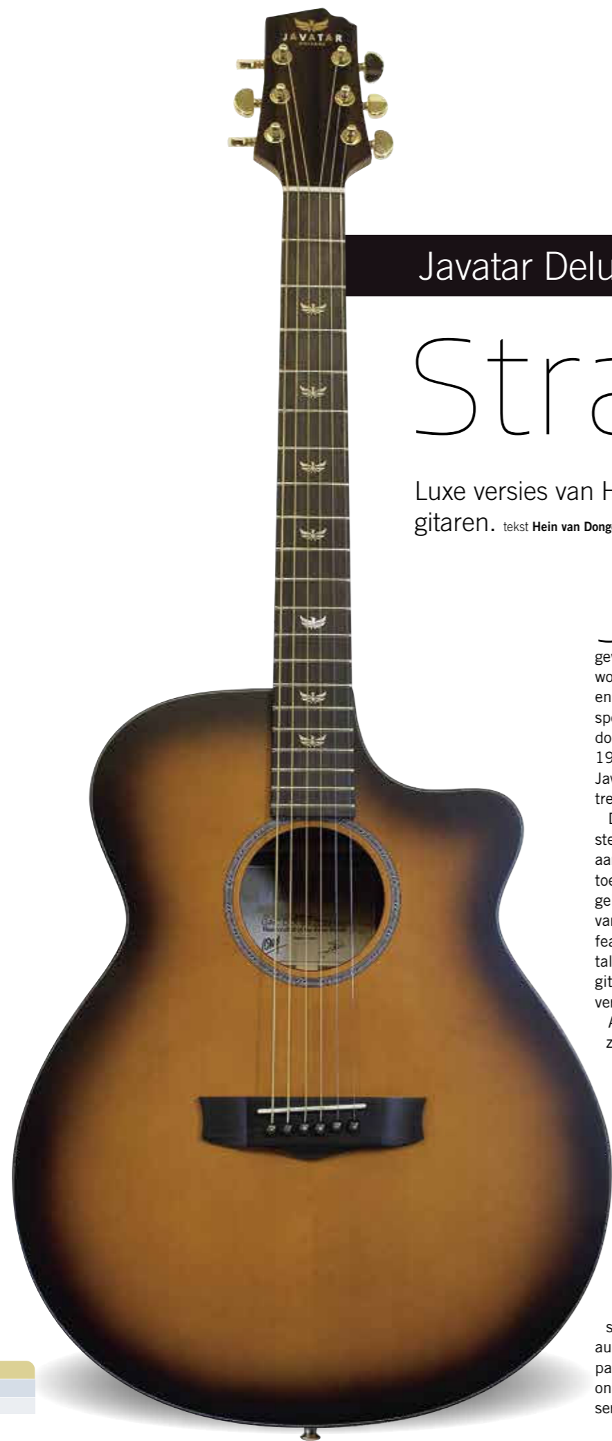
Javatar Deluxe Sunburst GAC